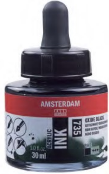
RT1720...0 30 ML.CAM ŞİŞE - 56 RENK