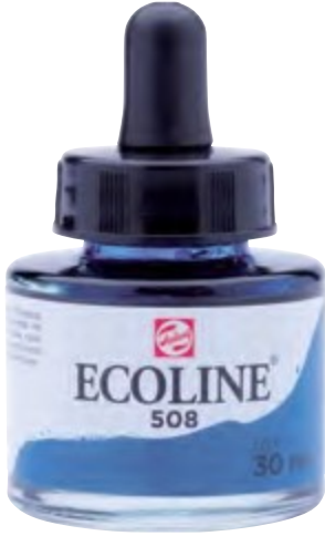
RT1125...0 30 ML.CAM ŞİŞE - 60 RENK

Kullanıma hazır suluboyalardır. Degrade geçiş yapmaya çok elverişli bir boyadır. Kağıda çok doğal yayılır, hakimiyeti kolaydır. Mürekkep üzeri suluboya uygulaması için uygundur.