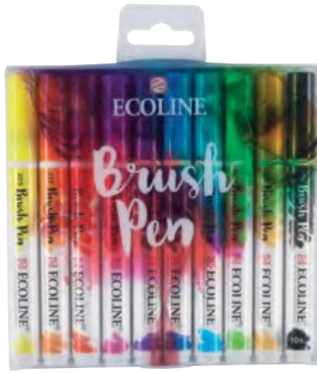
RT11509002 FIRÇA UÇLU KALEM 10'LÜ SET (205-227-237-334-337-548-506 578-600-700)