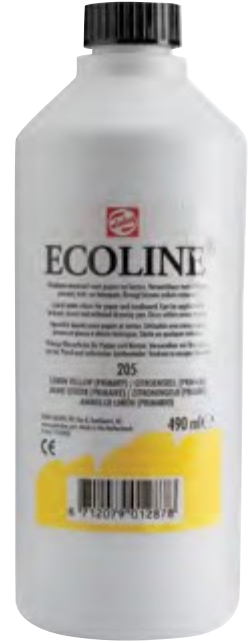
RT1172...0 490 ML.PLASTİK ŞİŞE - 5 RENK