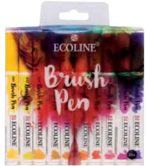
RT11509004 FIRÇA UÇLU KALEM 20'Lİ SET (201-202-233-236-237-311-318 337-548-507-578-508-522-601 600-656-227-407-411-700)