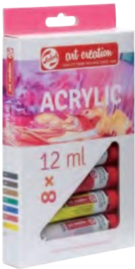
RT9021708M ART CREATION ACRYLIC 8x12 SET (105-275-396-572-619-227-409-701)