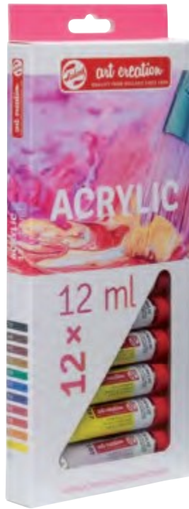
RT9021712M ART CREATION ACRYLIC 12 x12 SET (105-275-270-396-369-504-572-619-227-411-409-701)