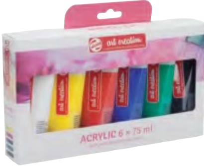
RT3582806M ART CREATION ACRYLIC 6 x 75 ML (105-275-396-504-572-619-701)