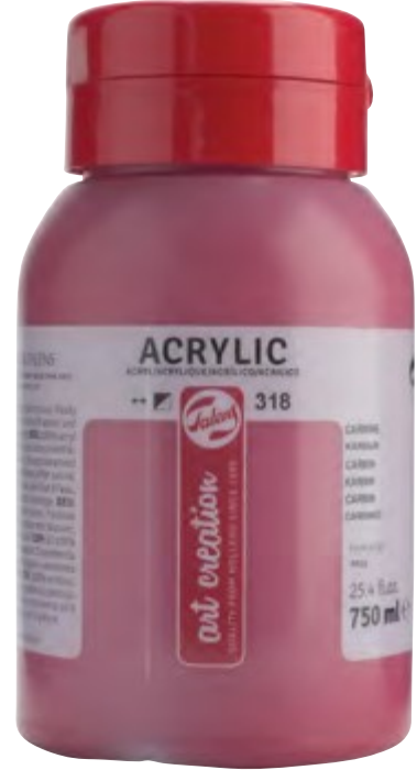
RT3574...M 750 ML.KOVA - 18 RENK