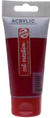
RT3511...M 75 ML TÜP - 38 RENK

Ekonomik, kaliteli akrilik boya. %100 akrilik reçineden oluşur. Hamurumsu kıvama sahip olan boya hızlı kurur.