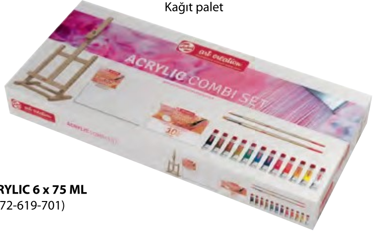
RT9011713M ART CREATION ACRYLIC COMBI SET 12 X12 ML (105-205-200-334-322-504-535-662 227-411-409-701) Masa üstü şovale Press tuval 2 Ad.Fırça Kağıt palet