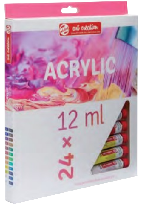
RT9021724M ART CREATION ACRYLIC 24 x12 SET (105 x 2-567-275-270-276-396-369-567-568-504-512-572-570-564-661-617-618-619-227-411-409-701)