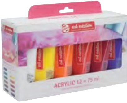
RT3582812M ART CREATION ACRYLIC 12 x 75 ML (105-275-276-396-318-568-504-564 619-227-411-701)